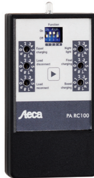
Z02 | 09.44 | DE / EN / ES / FR / IT / PT