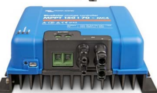
Contrôleur de charge solaire MPPT 150/70 MC4