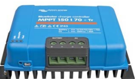
Contrôleur de charge solaire MPPT 150/70-Tr