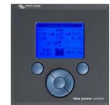
Tableau de commande Blue Power Se connecte à un Multi ou un Quattro, ou à tous les appareils VE.Net, en particulier le Contrôleur de batterie VE.Net. Affichage graphique des courants et des tensions.