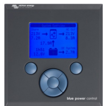
Tableau de contrôle Blue Power

Un solution pratique et bon marché pour une surveillance à distance, avec un bouton rotatif pour configurer les niveaux de Power Control et Power Assist.